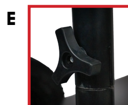
E Poignée facile à assembler