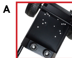
A Chassis soudé

Cette nouvelle génération CC2 au look moderne vous offre une réduction importante des vibrations, flexibilité de configurations du chariot, des crochets pour boyau et pistolet intégrés, la possibilité d'installer un dévidoir et finalement une stabilité et durabilité hors du commun.