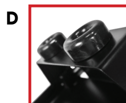
D Support frontal redessiné