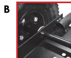
B Essieu soudé