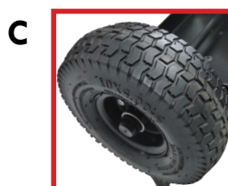
C Pneu de 10" gonflé