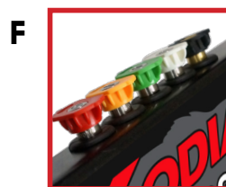
F 5 Buses de lavage